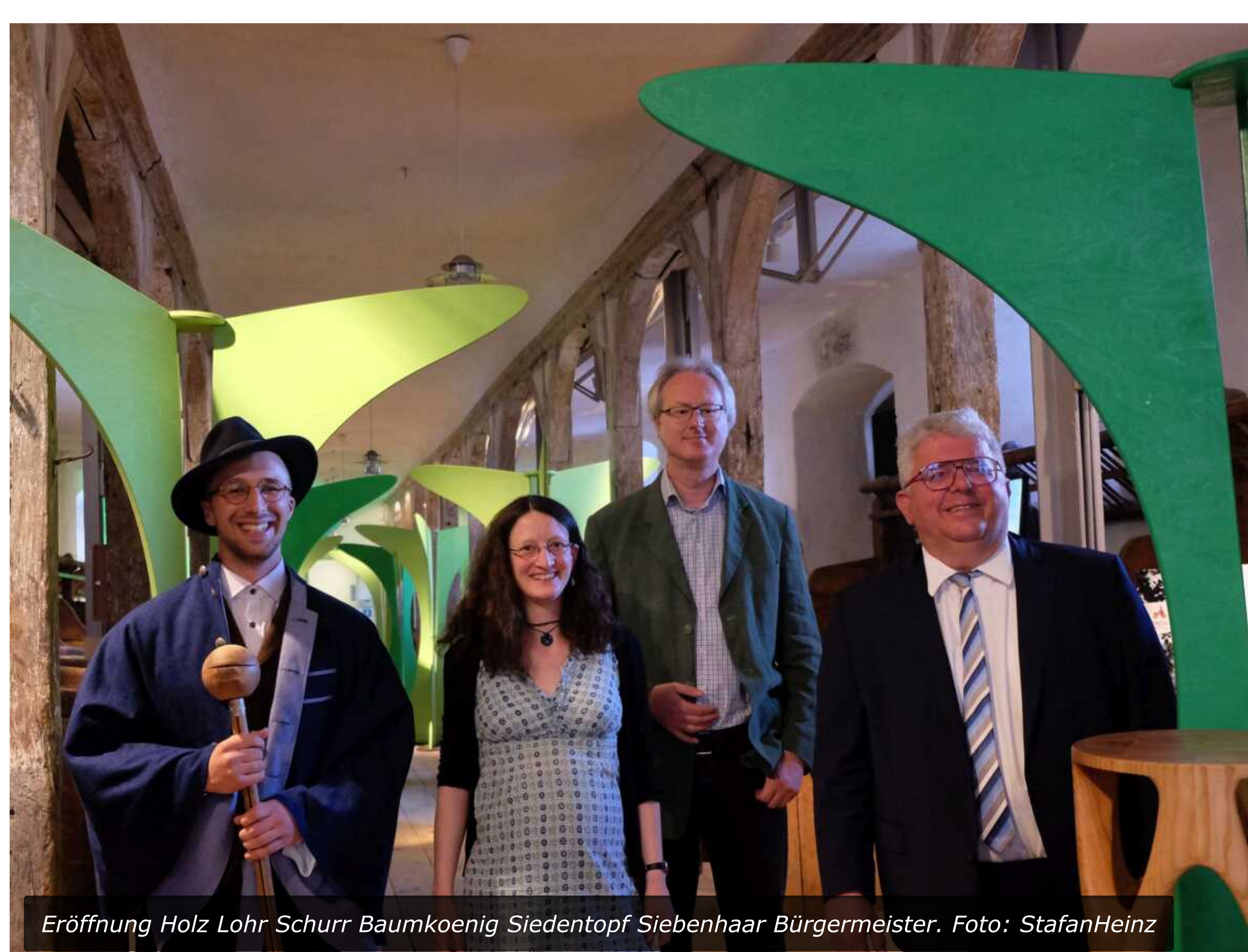
Eröffnung Holz Lohr Schurr Baumkoenig Siedentopf Siebenhaar Bürgermeister.

PRESEMITTEILUNG VERÖFFENTLICHT VON REDAKTION AM 21. MAI 2022